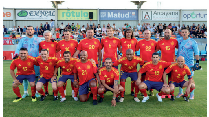
Jugadores de las leyendas de la selección española.