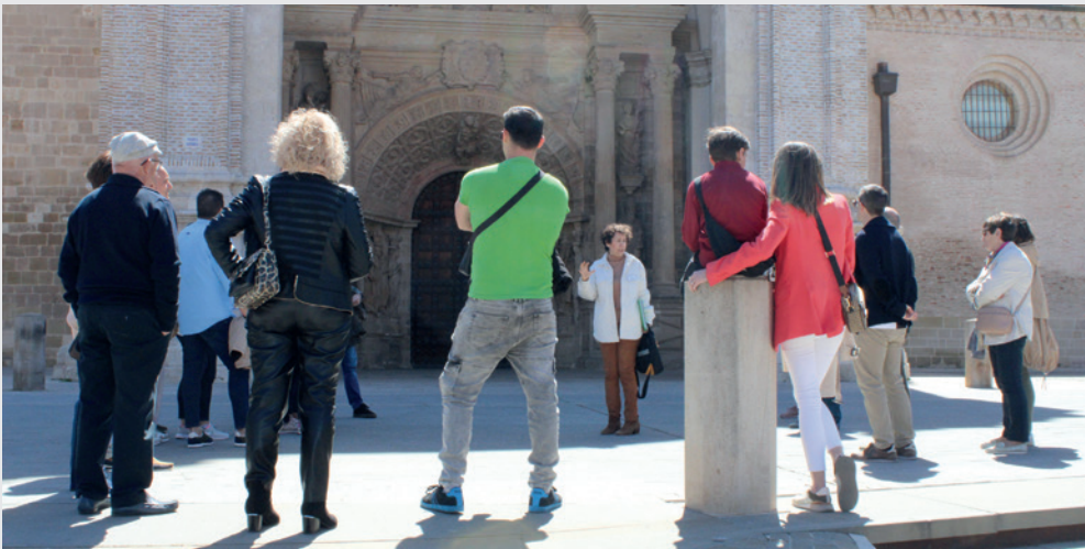
Las visitas en grupos son habituales todo el año.

Tarazona aspira a convertirse en un Destino Turístico Inteligente (DTI), y para lograr esta denominación, el Ayuntamiento ha comenzado con los trabajos asociados a este proceso de diagnóstico para