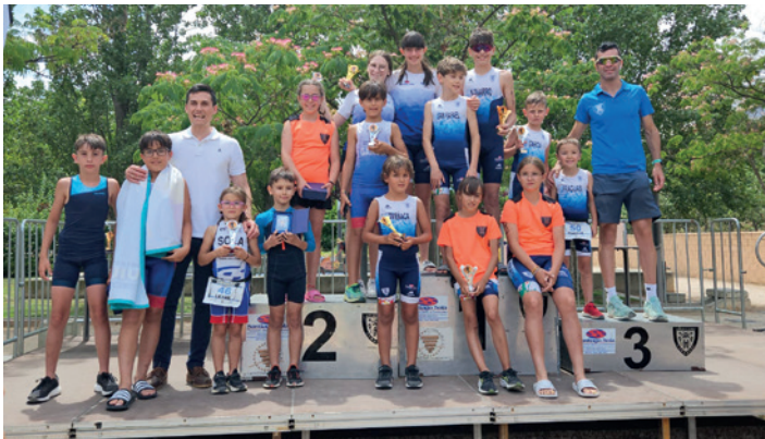
Algunos de los campeones del triatlón escolar.