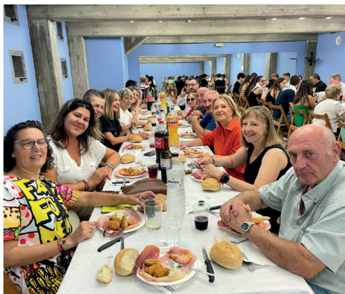
Cena de hermandad el sábado 27 de julio.