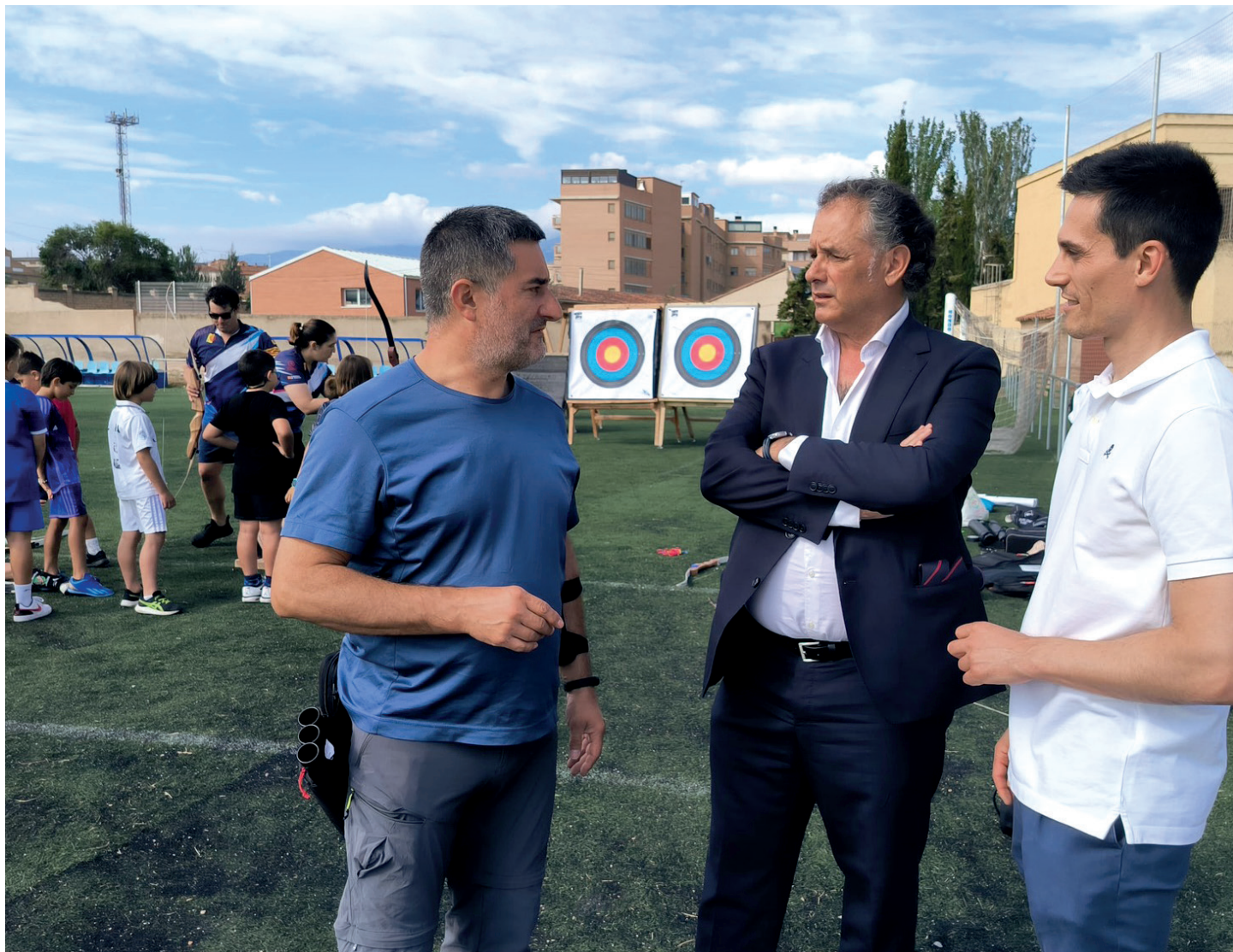
El tiro con arco se desarrolló en el polideportivo.

La celebración del Día del Deporte de la Comarca de Tarazona y el Moncayo en la ciudad del Queiles llenó de energía numerosos rincones del municipio tarazonense el pasado 13 de julio.