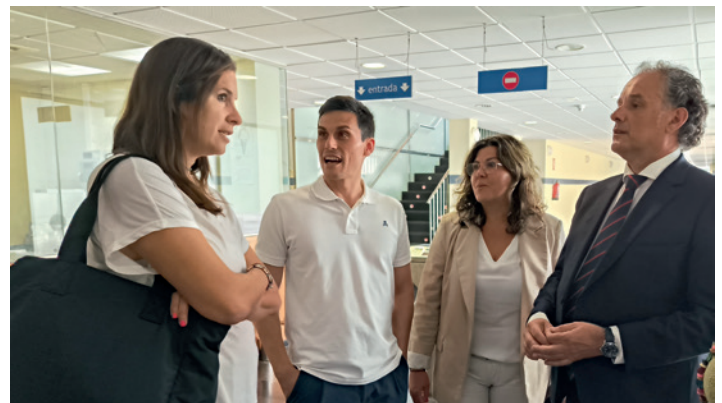
La directora general de Deportes de la DGA apoyó la jornada.