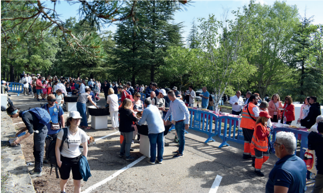
Concurrido reparto de migas en Agramonte.