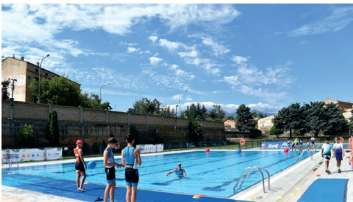
Natación en las piscinas de 'La Glorieta'.