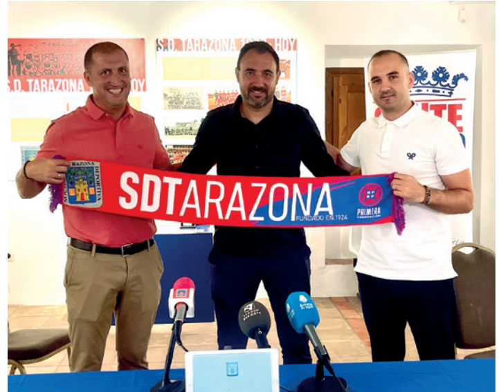
Presidente, entrenador y director deportivo durante la presentación.