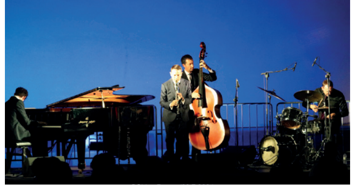
Cuarteto de jazz y blues.

Desde la Oficina de Cultura del Ayuntamiento de Tarazona se programó con éxito el ciclo 'Noches en el patio de Eguarás', una apuesta para llenar de música los viernes del mes de julio.