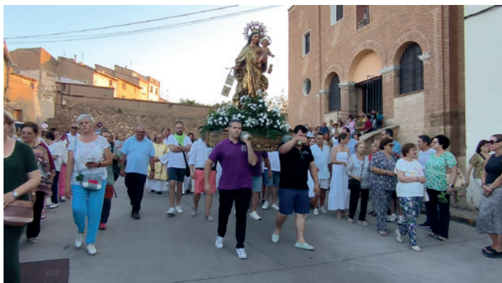
Procesión de la patrona, la Virgen del Carmen.

El barrio de La Almehora culminó con éxito sus fiestas del 12 al 21 de julio, este año con actividades taurinas incluidas, sin faltar la gastronomía, la música, concursos o charlas.