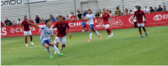
Jugada del partido entre rojillos y blanquillos.