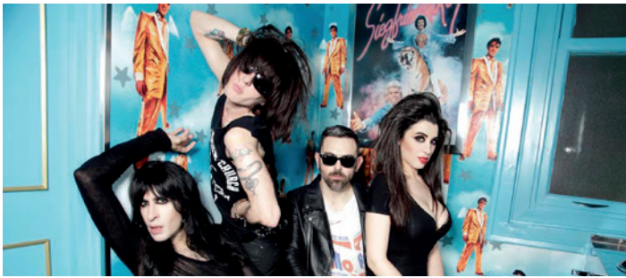
El grupo de las Nancys Rubias es uno de los platos fuertes musicales.

Estas citas musicales son gratuitas y se llevarán a cabo en el aparcamiento de la catedral