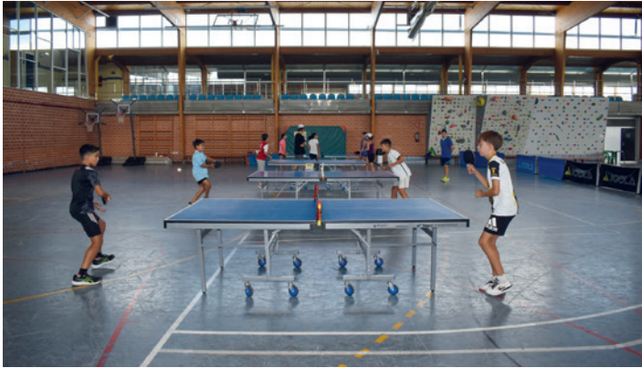
El tenis de mesa tuvo una gran aceptación.