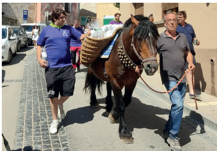
Recogida de tortas por el barrio.

El 16 de julio se celebró la Virgen del Carmen, patrona del barrio y una imagen que cuenta con gran devoción en la ciudad. El alcalde de la ciudad, Tono Jaray, acompañado de varios miembros de la Corporación Municipal, participaron en la misa y posterior procesión por las calles del barrio turiasonense.