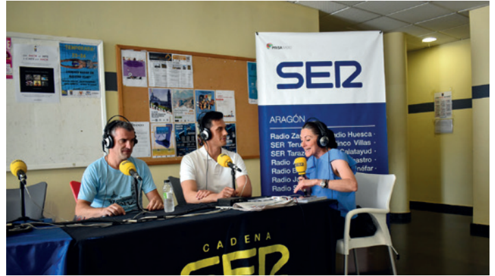
Cadena Ser celebró el Foro CONVERSA y el programa "A vivir Aragón"