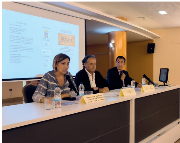
Inauguración del curso de verano en el Centro de Mayores.