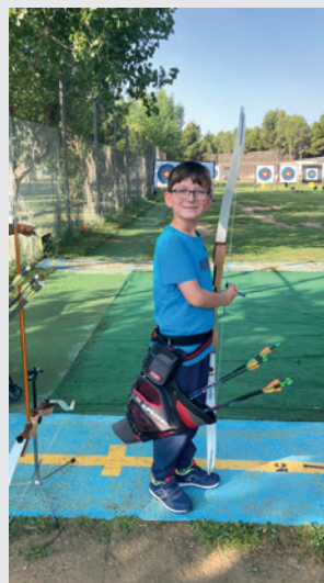
El joven arquero suma su primer título.