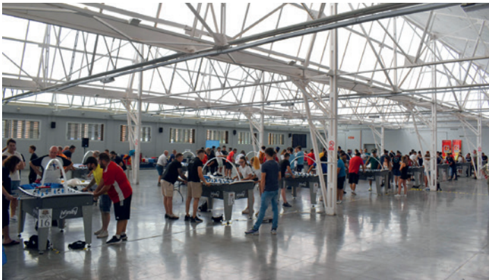
Torneo clasificatorio del mundial de fútbol.