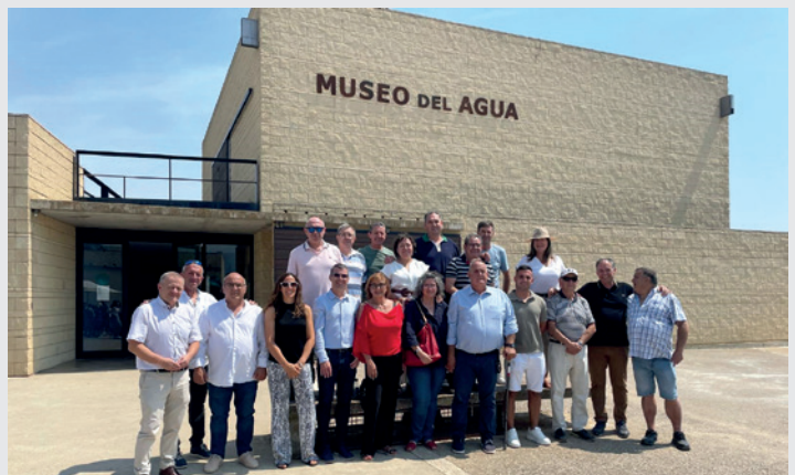
Reunión de alcaldes con el Museo del Agua al fondo.

Ya por la tarde, se pudo disfrutar de un interesante y entretenido escape room por las calles del pueblo. Dos citas musicales, con 'La voz de Eva' y 'La Orquesta', despidieron la programación festiva comarcal.