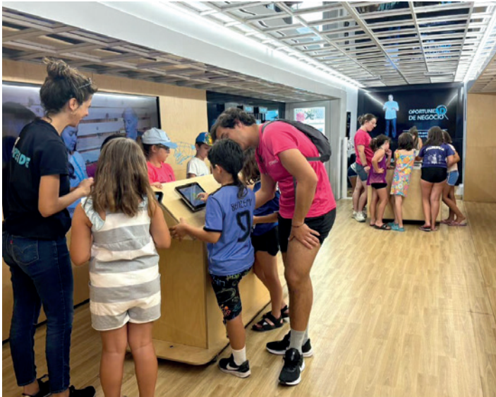
Jóvenes turiasonenses realizando juegos interactivos.

El taller itinerante 'LabEmprende' de EduCaixa llegó a Tarazona del 22 al 26 de julio. El autobús estacionó en la plaza de San Francisco y allí niñas y niños disfrutaron con actividades interactivas y multimedia con las que pudieron aprender el concepto de emprendimiento y las características y valores de una actitud emprendedora.