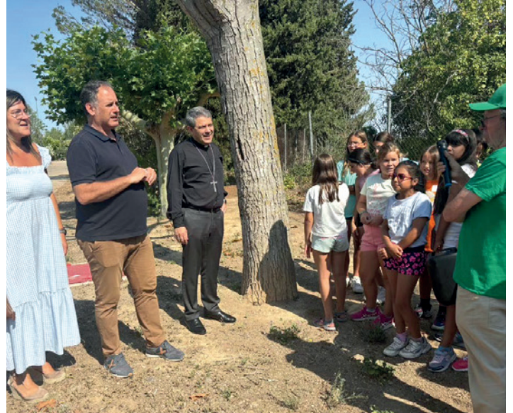
Visita en el seminario a los niños de los talleres.

Desde el Ayuntamiento se agradeció la colaboración del Obispado de Tarazona en la cesión del Seminario para las actividades, incidiendo por otra parte también en la ampliación de horarios efectuada este año para lograr una mejor conciliación de las familias.