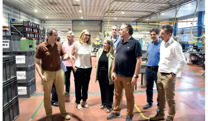
Recorriendo una de las dos fábricas del polígono.

En relación a esto, cabe destacar que el día 22 el consejero de Fomento, Vivienda, Logística y Cohesión Territorial del