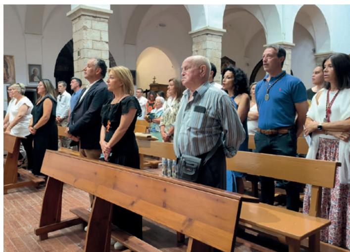
Misa en honor a Santa María Magdalena.

La programación festiva continuó hasta el 28 de julio con destacadas citas gastronómicas como el concurso de postres o de ranchos, el taller de gastronomía venezolana, almuerzos, y cena de hermandad, entre otras actividades.