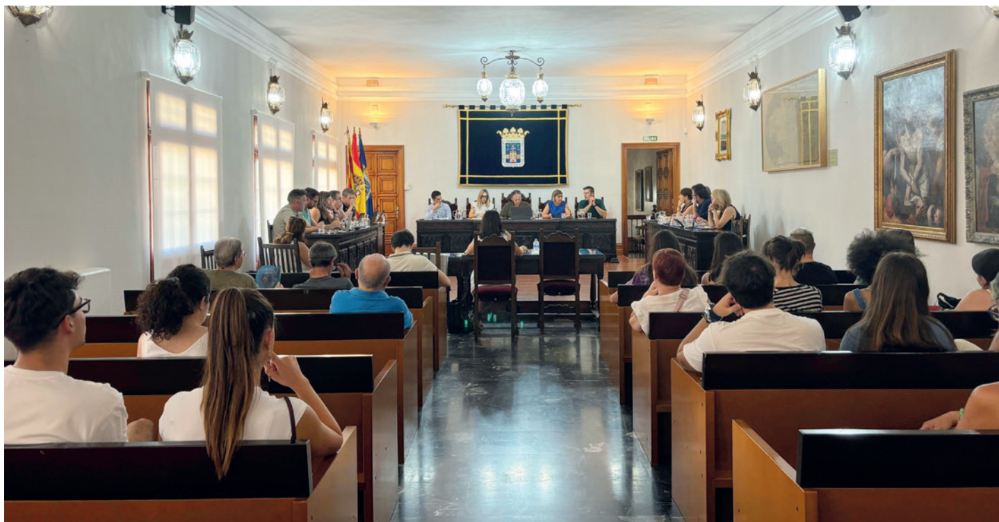
Varios vecinos se acercaron a la sesión del pleno.

El Consistorio invertirá más de 1,1 millones de euros en la licitación de este contrato